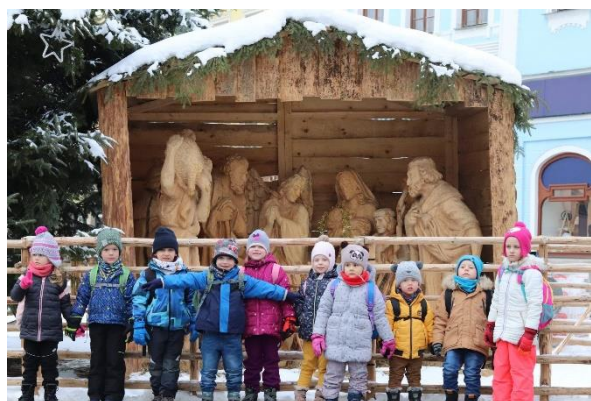
Výlet do Jindřichova Hradce