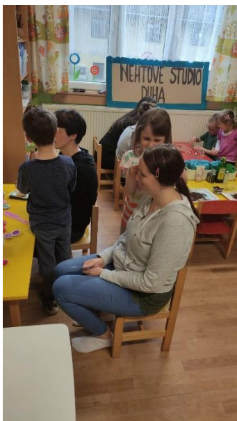
Wellness pro maminky