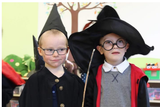
Čarodějnice v MŠ